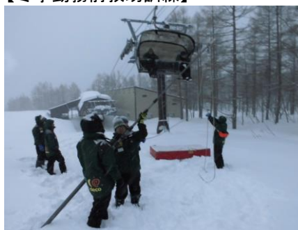
【冬季勤務前救助訓練】