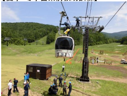
【夏季・冬季営業前救助訓練】