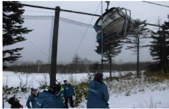
【冬季勤務前救助訓練】