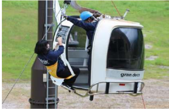
【夏季勤務前救助訓練】