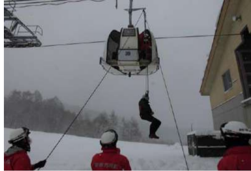
【冬季シーズン前救助訓練】