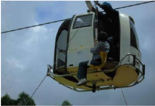
【夏季シーズン前救助訓練】